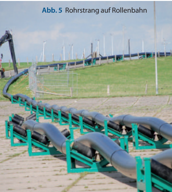
Abb. 5 Rohrstrang auf Rollenbahn