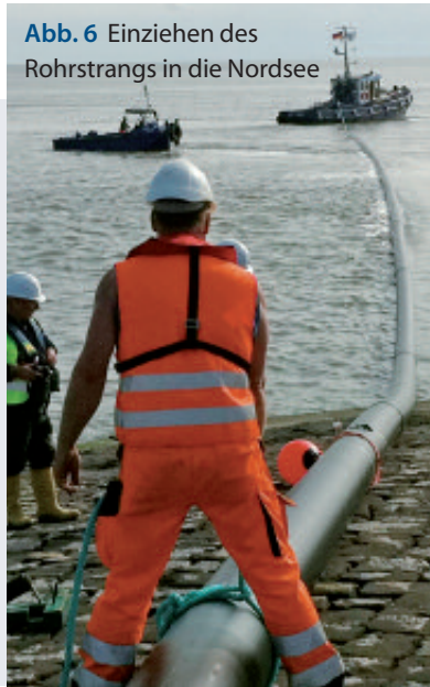
Abb. 6 Einziehen des Rohrstrangs in die Nordsee