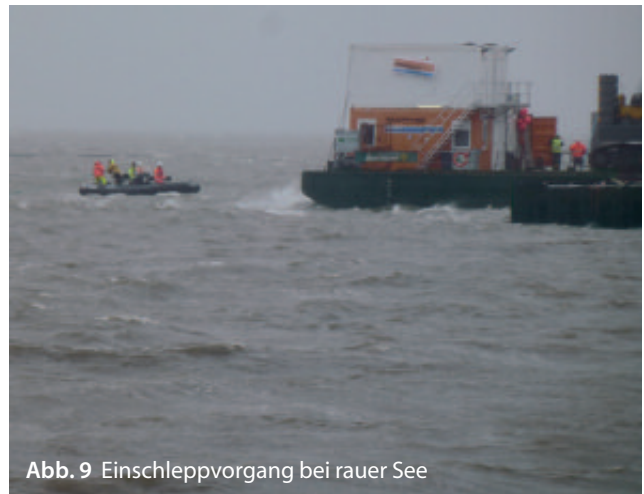
Abb. 9 Einschleppvorgang bei rauer See

des Wattenmeeres zu verhindern. In den Ringen wurden Aufnahmen für leistungsstarke Tauchpumpen installiert, die in der Lage sind, Bohrspülung über Strecken von 200 m zu verpumpen. Für die Positionierung der Ringe im Watt stand ein Spezialbagger bereit, der aufgrund besonders breiter Fahrwerksketten eine sehr geringe Bodenpressung aufbrachte. Wattfahrten mit dem Bagger wurden im Hinblick auf eine möglichst geringe Belastung des Wattbodens nur für die Verlegung der erforderlichen Bentonit-Rückspüleleitung sowie für den Havarieeinsatz bei Spülsausrüchen genehmigt (Abb. 4).