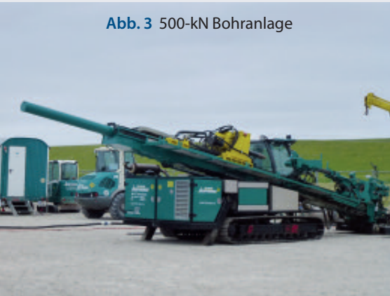
Abb. 3 500-kN Bohranlage