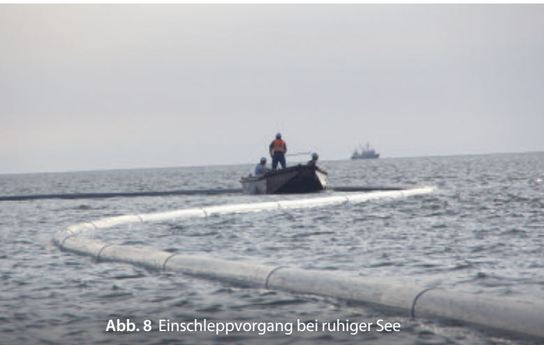
Abb. 8 Einschleppvorgang bei ruhiger See